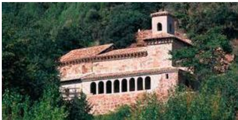
El monasterio riojano de Suso, en San Millán de la Cogolla, lugar del “primer vagido” –según Dámaso Alonso— del español,

El ermitaño Millán está enterrado en el monasterio de Suso. Hoy se ven las partes visigodas, mozárabes y románicas del cenobio. Es pequeño, escueto y ascético, con ese aire primitivo que predispone a la humildad y a vérselas con la manera interior de vivir el tiempo. El visitante puede ver el sarcófago del santo y, quizás con más estremecimiento, un buen montón de huesos. Los huesos nunca engañan, decía Pedro Salinas. La